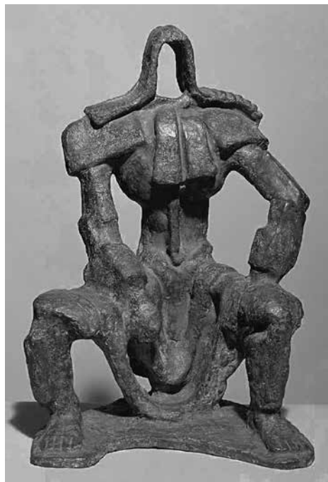
Ζίγκφριντ Σαρού, Πολιτισμός: ο Δικαστής , 1962, μπρούντζινο γλυπτό, 49,5x33x27 cm, Μουσείο Σαρού, Λάνγκεντσερσντόρφερ Μουζέεν, Αυστρία.

Αν και η σχετική βιβλιογραφία για τα ρεμπέτικα είναι πολύ μικρότερη από αυτή των δημοτικών, εντούτοις η έρευνα προχωράει από ενθουσιώδεις νέους. Κι όλο και κάτι καινούργιο μαθαίνουμε. Στο XII Συνέδριο για το Μεσογειακό Τραγούδι, που οργανώνει το Πανεπιστήμιο Κύπρου, ο καθηγητής εθνομουσικολογίας Γλαύκος Νεάρχου έκανε μια πολύ ενδιαφέρουσα ανακοίνωση για τις άγνωστες καταδικές του Τσιτσάνη από την ελληνική Δικαιοσύνη. Να παραθέσω εν περιλήψει αυτήν την εκτεταμένη ανακοίνωση: