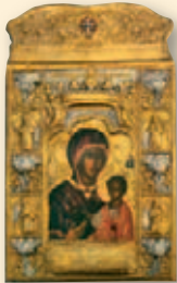
Η Παναγία ή Αθηνιώτισσα

Π ολύς λόγος έγινε τελευταίως για την περιβόητη ταινία μικρού μήκους που προβάλλεται στους επισκέπτες του νέου μουσείου της Ακρόπολης.